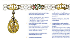
ORDEN VAN MILITAIRE VERDIENSTE