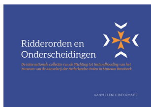
ORDEN VAN MILITAIRE VERDIENSTE

Daarmee is 'Ridderorden en onderscheidingen' een boekje geworden dat niet alleen voor de bezoeker aan de opstelling interessant is, maar voor eenieder die belang stelt in ridderorden en onderscheidingen. Om die reden is 'Ridderorden en onderscheidingen' ook te koop. De prijs bedraagt 3,95 euro (4,95 euro inclusief verzendkosten). U kunt het boekje bestellen door een berichtje te sturen naar secretariaat@kanselarijmuseum.nl . Het boekje is ook te koop in de winkel van Museum Bronbeek.